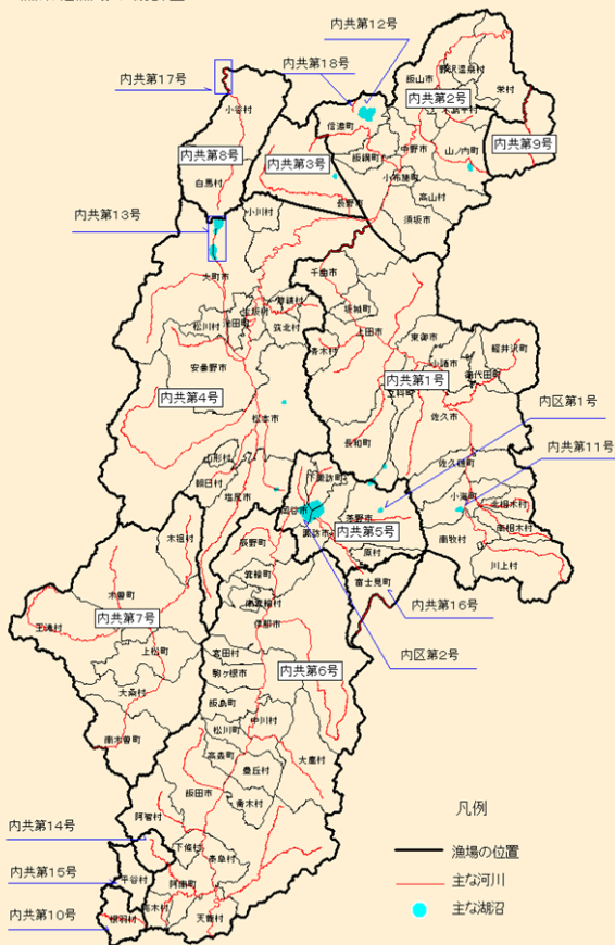
漁業権漁場の概要図